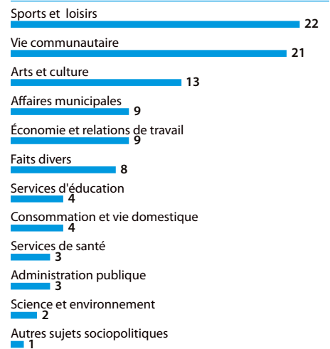
3. Part (%) des articles consacrés aux différents thèmes en 2002

● Deux articles sur trois traitent de sujets « légers » qui ne prêtent habituellement pas à controverse: les sports et les loisirs, la vie communautaire (activités d'associations, portraits de gens du milieu, etc.), les arts et la culture, les faits divers ainsi que les questions reliées à la consommation (graphique 3). Il n'y a donc que le tiers des articles qui s'intéressent aux sujets plus « politiques » tels que les affaires municipales, l'économie et les relations de travail, les services d'éducation, les services de santé et l'environnement. C'était 40 % il y a 10 ans.